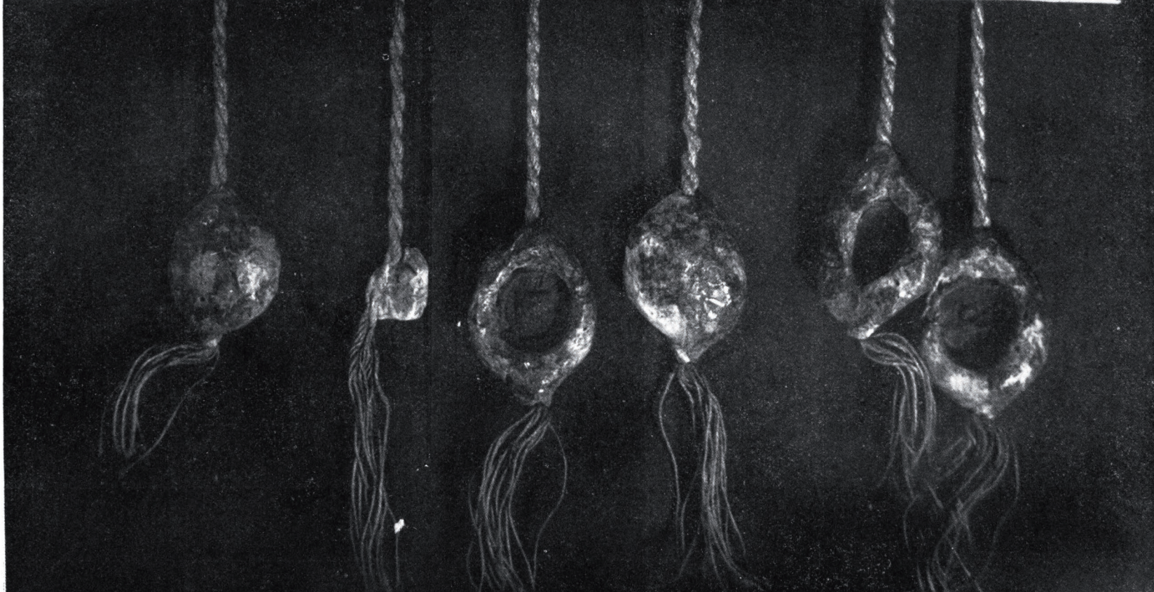
Sl. 1. Listina od 19. VII. 1433.

Handwritten text in a medieval script, likely a list or document. The text is written in a dense, cursive hand and is arranged in several lines across the page. The script is characteristic of the 14th or 15th century. The document is a list of items, possibly a inventory or a list of goods, as indicated by the caption.